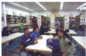
תלמידים בספרייה ביי"ס על שם יצחק רבין בכפר הערבי טירה .

התלמידים הערבים והדרוזים לומדים מקצועות לימוד שהם ייחודיים לחברה ולתרבות הערבית והדרוזית. הם לומדים ספרות, דת, מורשת והיסטוריה של הערבים או הדרוזים, לצד מקצועות לימוד משותפים כמו: אזרחות, מתמטיקה, אנגלית ומדעים. בשנים האחרונות חלו שינויים במערכת החינוך הערבית: הוקצו