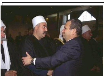
ראש הממשלה לשעבר אהוד ברק לוחץ את ידו של ראש העדה הדרוזית השיך טאריף בחגיגות עיד אל פיטר. 2000

השלישית בגודלה בעולם מתוך כ-1.5 מיליון דרוזים בעולם. (שוקי אמרני, הדרוזים בין עדה לאום ומדינה , אוניברסיטת חיפה, 2010.)