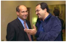
חברי הכנסת אחמד טיבי